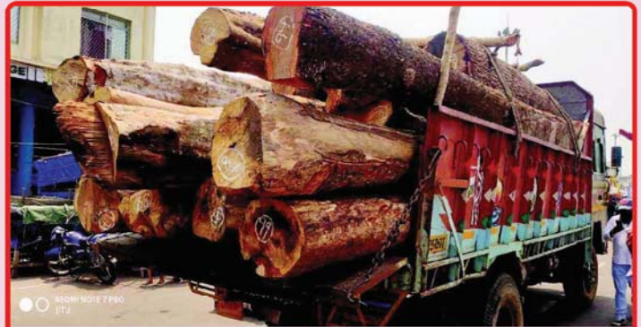
ତା. ୨୩.୩.୨୨ରେ ଚଳିତ ବର୍ଷ ମହାପ୍ରଭୁଙ୍କ ରଥଯାତ୍ରା ନିମନ୍ତେ ଦ୍ଵିତୀୟ ପର୍ଯ୍ୟାୟରେ ୩୪୫୫ ଅସନ ଓ ଧଉରା କାଠ ନୟାଗଡ଼ ବନଖଣ୍ଡରୁ ଦୁଇ ଗୋଟି ଟ୍ରକ୍ ଯୋଗେ ରଥ ଖଳା ଠାରେ ପହଞ୍ଚିଛି ।

● ମହାସଚିବ, ଶ୍ରୀଜଗନ୍ନାଥ ଚେତନା ଗବେଷଣା ପ୍ରତିଷ୍ଠାନ, ପୁରୀ